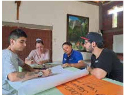
Transferencia de conocimiento sobre prevención de violencia a organizaciones de la sociedad civil, en el marco de los Diálogos de Resiliencia.