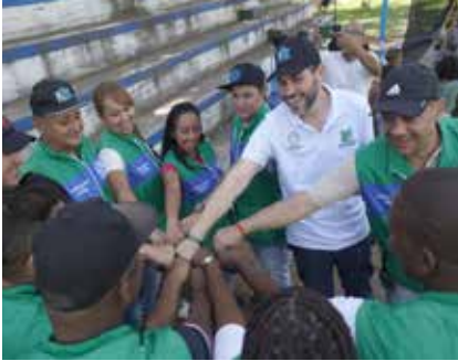
Gestores de Convivencia del componente de Interrupción.

De esta manera, PAZOS desarrolla un componente direccionado a este nivel: