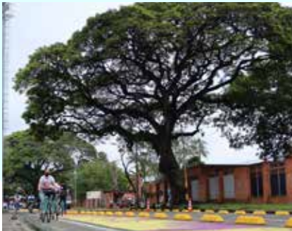
Ciclorruta realizada con Fundación Despacio en un barrio de PAZOS.

De esta manera, PAZOS desarrolla un componente direccionado a este nivel: