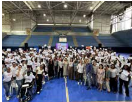
Segunda Cohorte de Forjadores graduados en 2023 tras culminar la ruta psicosocial, de generación de ingresos y fomento de la ciudadanía.

Componentes de Intervención. Se brindó acompañamiento cercano para generar oportunidades a las personas con mayor riesgo de involucrarse en dinámicas de violencia, haciendo énfasis en el trabajo para el desarrollo de resiliencia y capacidades en jóvenes y ex presidiarios como agentes de transformación social de sus comunidades. El objetivo principal fue construir proyectos de vida en el marco de la legalidad, a partir del acompañamiento psicosocial, la adquisición de competencias blandas y su puesta en funcionamiento para la generación de ingresos de manera legal. Este componente fue liderado por las secretarías de Integración Social, Gobierno y la Dirección de Emprendimiento y Desarrollo Económico.