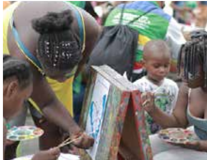
Jornada de Prevención de la Secretaría de Gobierno y Cultura en un barrio de PAZOS.

Componentes de Prevención. Consistió en desarrollar habilidades en niños, niñas, adolescentes, jóvenes, familias y comunidades para prevenir el uso de la violencia y promover la resolución pacífica de conflictos con estrategias orientadas a distintos grupos etarios a partir del trabajo misional de las distintas secretarías del municipio: