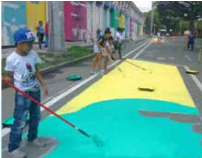
Niños, niñas, adolescentes y jóvenes en colaboración conjunta para la elaboración de la ciclorruta.