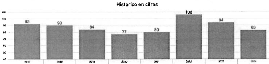
Gráfico 3. Registro Histórico de Víctimas Fatales por Siniestros Viales en Palmira.