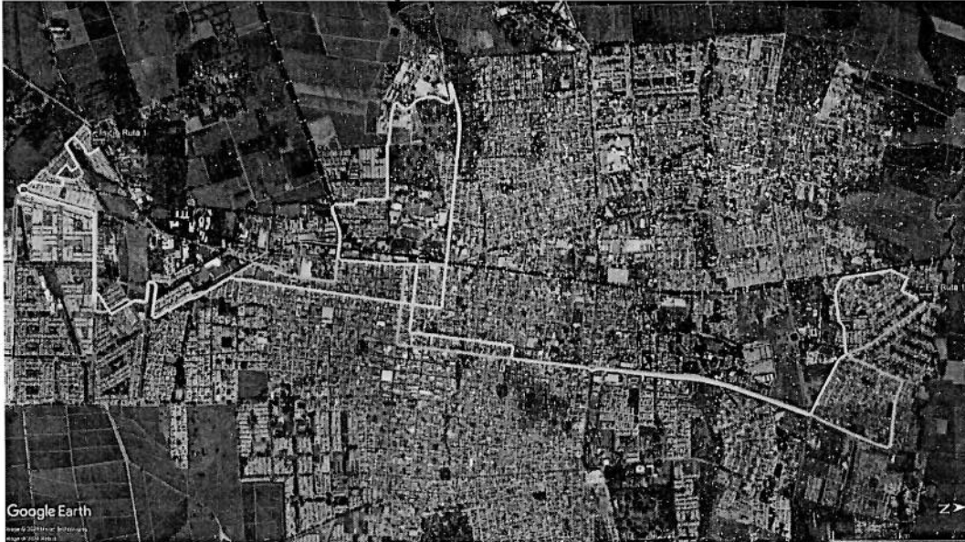
Figura 1. Trazado Ruta 1