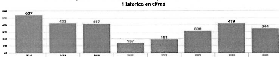
Gráfico 4. Registro Histórico de Lesionados por Siniestros Viales en Palmira.